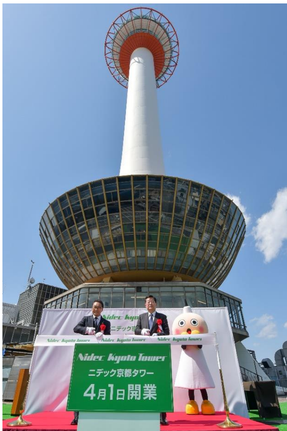
セレモニーの様子

ニデック株式会社（以下、当社）は、2024年4月1日、「ニデック京都タワー（Nidec Kyoto Tower）」のオープニングセレモニーを実施いたしました。