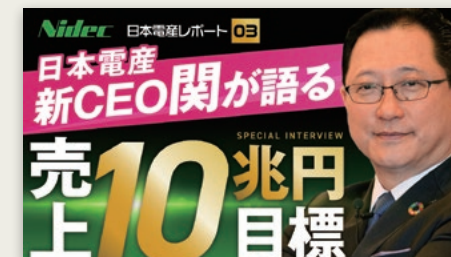
個人投資家様向けIR動画第3弾