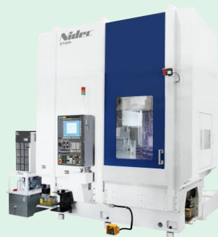
ヘリカルガイドレス ギヤシェーパ ST40A