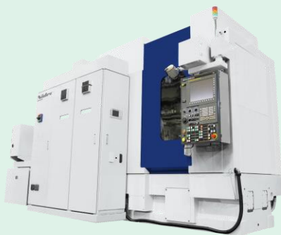
歯車研削盤 ZE40A (組立中)