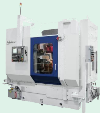
ホブ盤 GD30・GB63 (組立中)