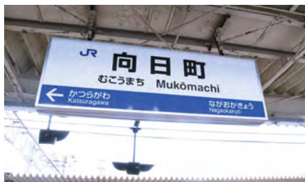
1. JR 向日町駅ご到着