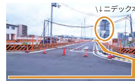
12. ニデック本社方面に渡ってください