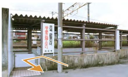
10. 直進してください