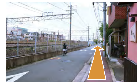
4. さらに道なりにお進みください