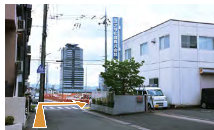
11. 横断歩道を渡ってください