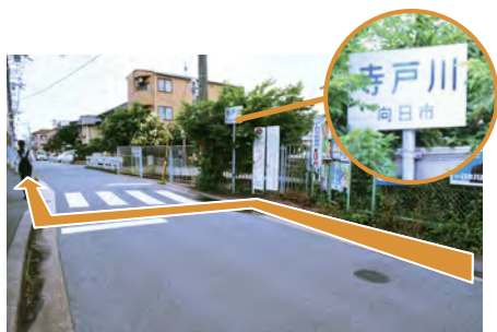
5. 寺戸川看板前の横断歩道を横断