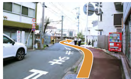
3. 歩道を道なりにお進みください