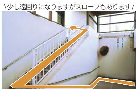
9. 階段を上り地下道を出てください