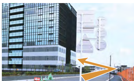
14. ニデックパークC棟の角を左折