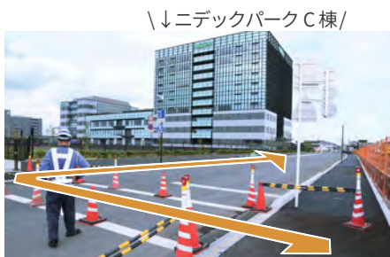
13. 横断歩道を渡ってください