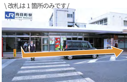
2. 改札を出たら左折してください