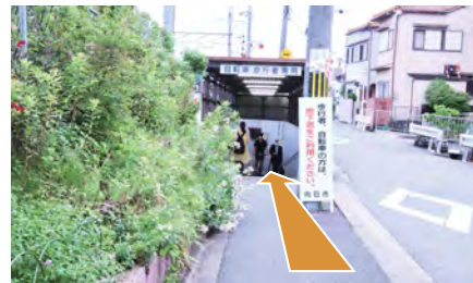
7. 地下道にお入りください