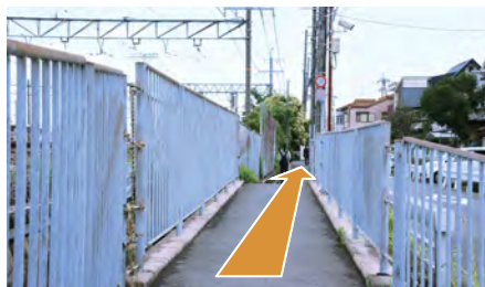
6. 道なりにお進みください