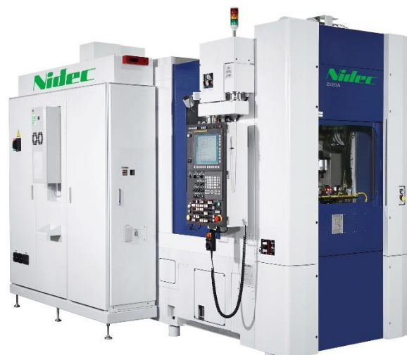
【量産用内歯車研削盤「ZI20A」】