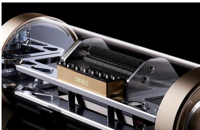
職人の手でひとつひとつ削り出され、調整される心臓部の「櫛歯」 オルフェウスオルゴールならではの「生演奏」の音色を奏でる