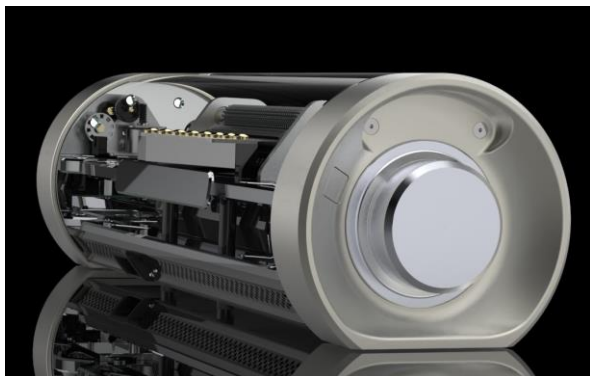
直感的な操作を可能にするアルミ削り出しのダイヤル 細部までこだわった質感の高いディテールが所有感を充足させる

新製品「オルフェウス KANATA」は、1946年の創業以来、日本初の国産オルゴールを制作し、本格的なオルゴールを生産しつづけてきた世界でも数少ないメーカーである日本電産サンキョーが、長年培ってきた技術・ノウハウを注ぎ込んで完成させた最新型オルゴールです。高級車フェラーリや新幹線、伝統工芸品に至るまで、様々な製品デザインを手掛ける世界的な工業デザイナー奥山清行氏とともに生み出した、現在作り得る世界最高峰のオルゴール製品です。精緻な内部機構を“目で楽しめる”LED照明を内蔵したスケルトンボディ、アルミ・真ちゅう・鉄といったメタルパーツが放つ重厚な質感、繊細で奥行きのある「生演奏」の音質を実現する厳選した素材と新たな構造、そして日本電産サンキョーの職人が仕上げる「匠」の加工技術、これら革新と伝統が融合することで実現したマスターピースです。さらに、セットになっている世界的な「天童木工」が制作した専用の共鳴台が、「オルフェウス KANATA」が奏でる生演奏の響きをより一層引き立てます。