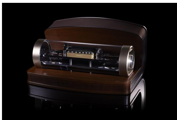
曲げ木を駆使した木工技術を有する「天童木工」製 成形合板で複雑な曲面や美しいフォルムを実現