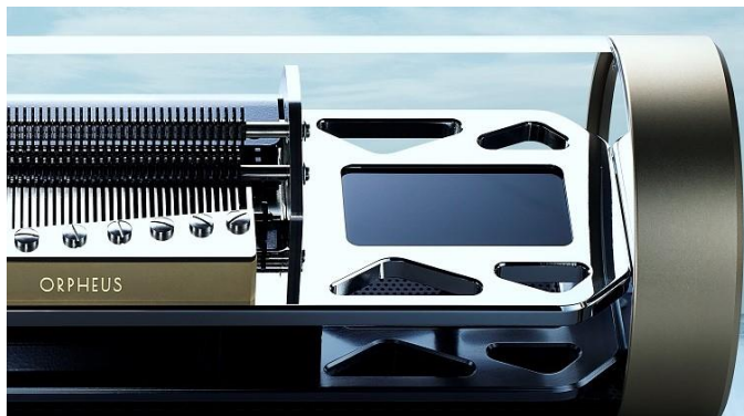
精緻な内部機構が動く様子を“見て楽しめる” スケルトンボディ メタルフレームの質感を一段と引き立てる