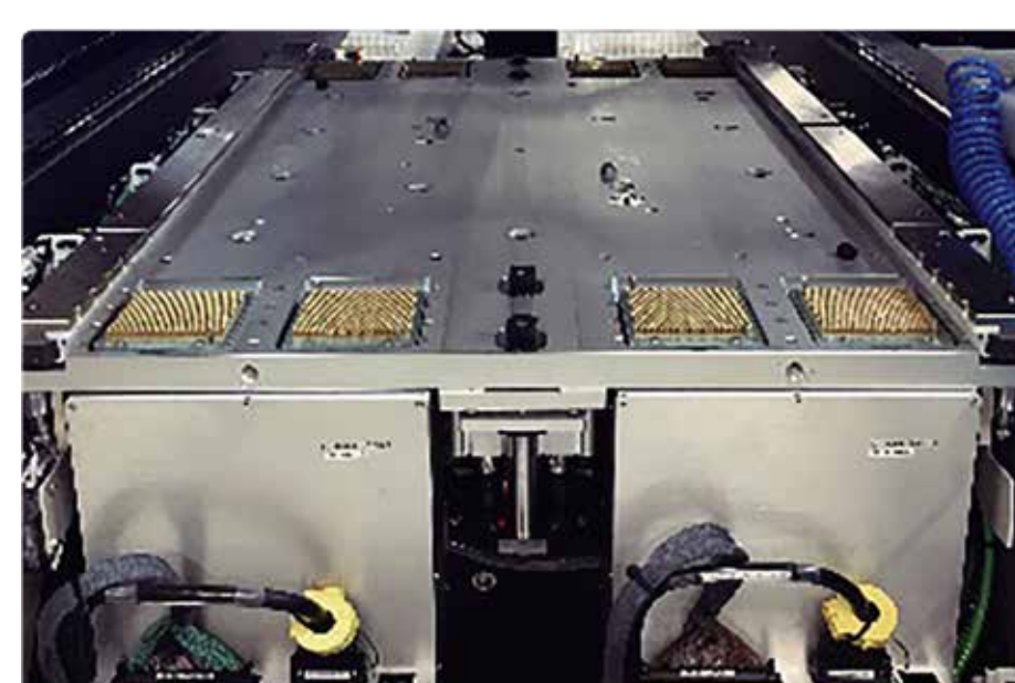
■ Scanner Module

自動テンション & クランプ機構 Automatic Tension & Clamp System