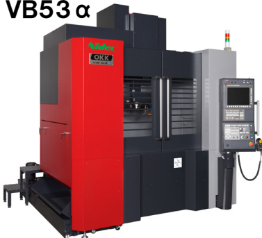
立形マシニングセンタ VB53α