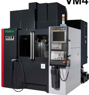
立形マシニングセンタ VM43R II