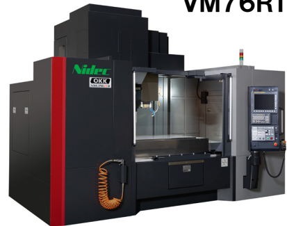
立形マシニングセンタ VM76R II