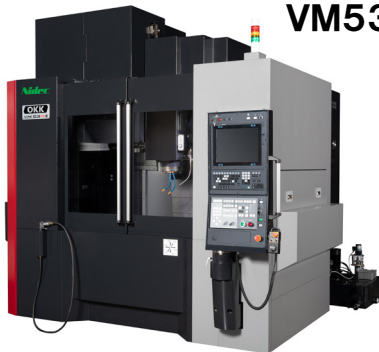
立形マシニングセンタ VM53R II